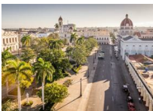
La Havane 📍 🚗 250km - ⌚ 3h