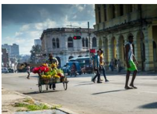
La Havane 📍