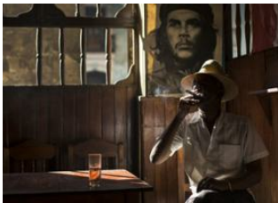
Cayo Santa María 📍 🚗 400km - ⌚ 5h La Havane 📍