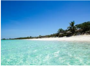
Cayo Santa María 📍