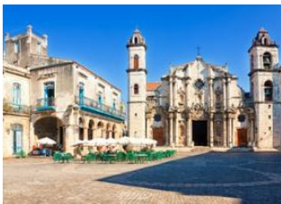
La Havane 📍