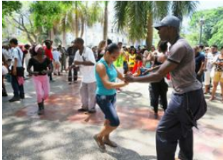
La Havane 📍