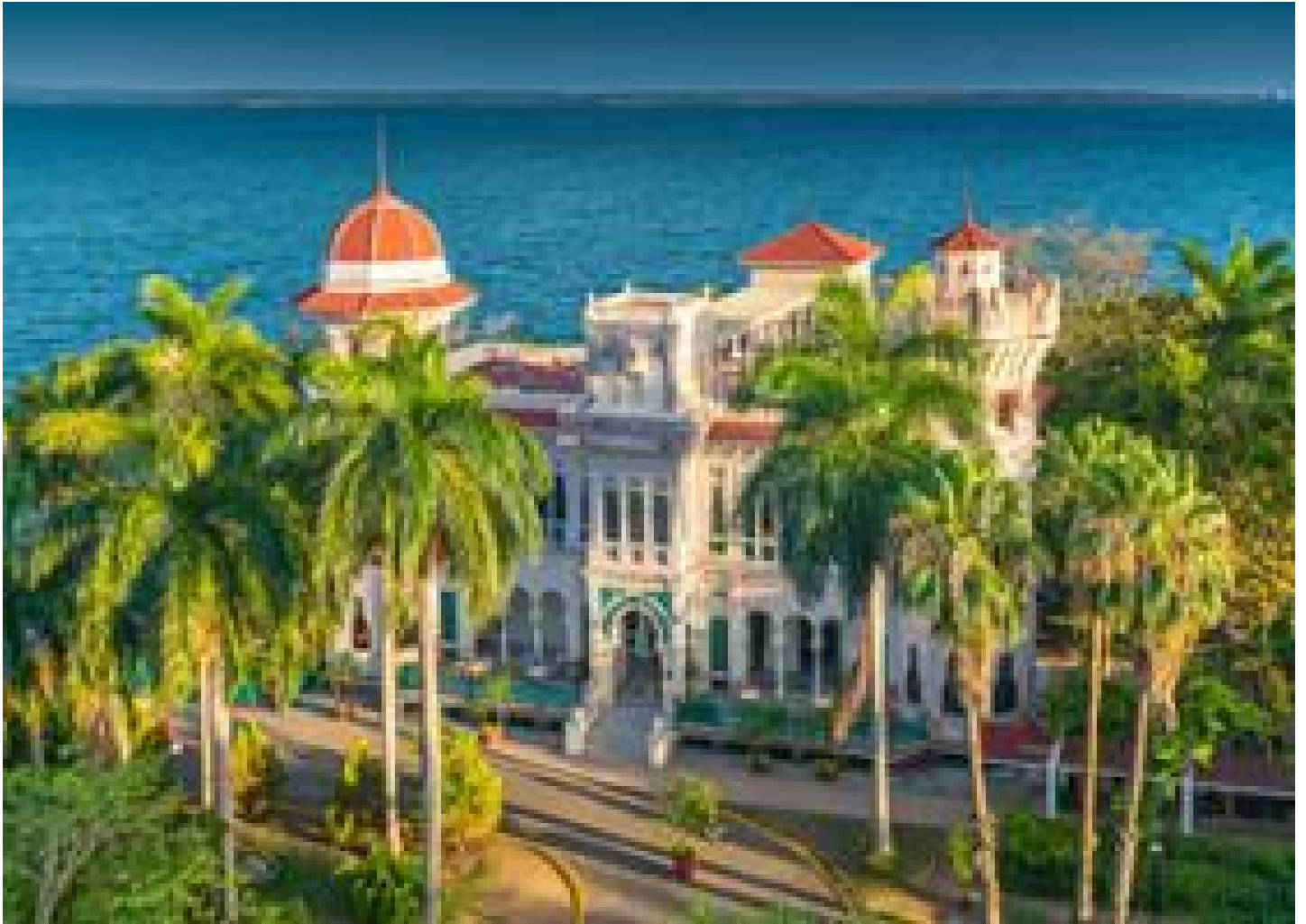
Ciénaga de Zapata 200km - 3h Trinidad